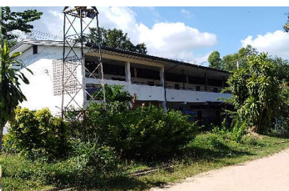
อาคารเรียน สปช.๑๐๕/๒๖ ปีที่สร้าง ๒๕๓๗