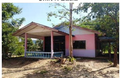
หอสมุด ปีที่สร้าง ๒๕๔๘ (ไม่ใช้งบประมาณจากทางราชการ)