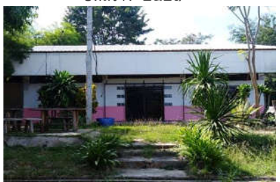
อาคารอเนกประสงค์สปช.๒๐๒/๒๖ ปีที่สร้าง ๒๕๒๙