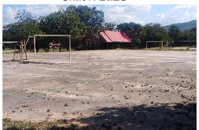
ลานกีฬาอเนกประสงค์ ปีที่สร้าง ๒๕๕๒ (ไม่ใช้งบประมาณจากทางราชการ)