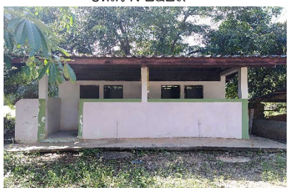
ส้วม สปช.๖๐๑/๒๖ ปีที่สร้าง ๒๕๒๖