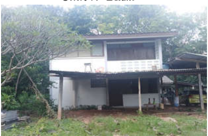
บ้านพักครูองค์การฯ ปีที่สร้าง ๒๕๒๑