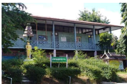
อาคารเรียน ป.๑๓ ปีที่สร้าง ๒๕๒๑