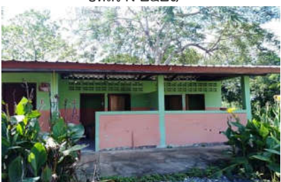
ส้วม สปช.๖๐๑/๒๖ ปีที่สร้าง ๒๕๓๔