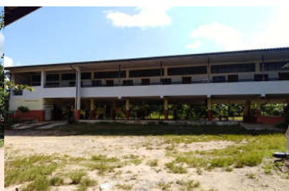
อาคารเรียน สปช.๑๐๕/๒๙ ปีที่สร้าง ๒๕๔๔