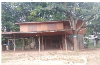
บ้านพักครูสปช.๓๐๑/๒๖ ปีที่สร้าง ๒๕๓๔